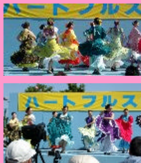
あいかわらず大人気