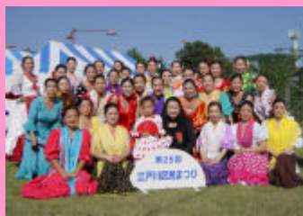
音響のトラブルにもめげず 見事に踊りきりました！