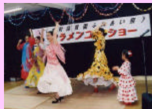
活気溢れる保育園での交流は、とても心温まるものでした。